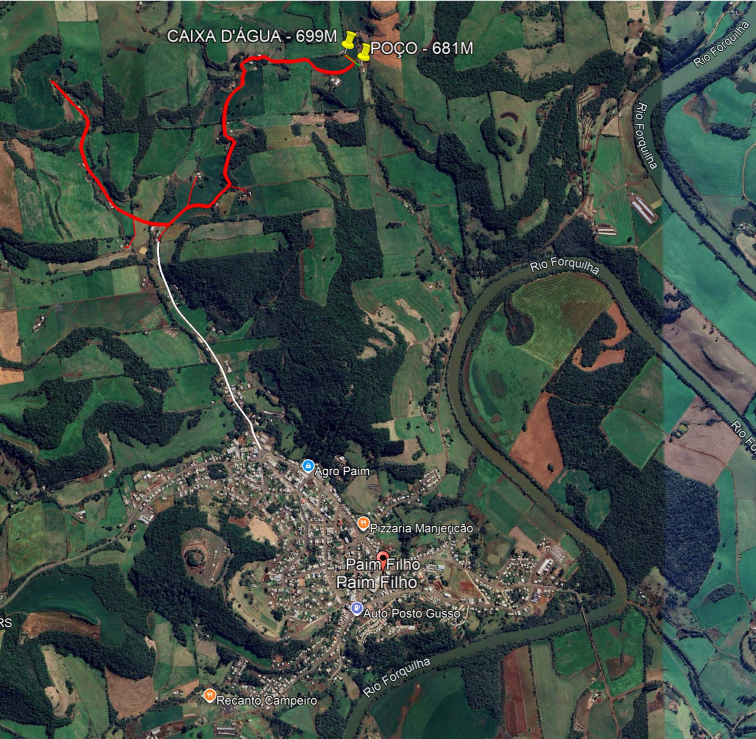
Imagem Google Earth: localização da comunidade de Santo Antônio